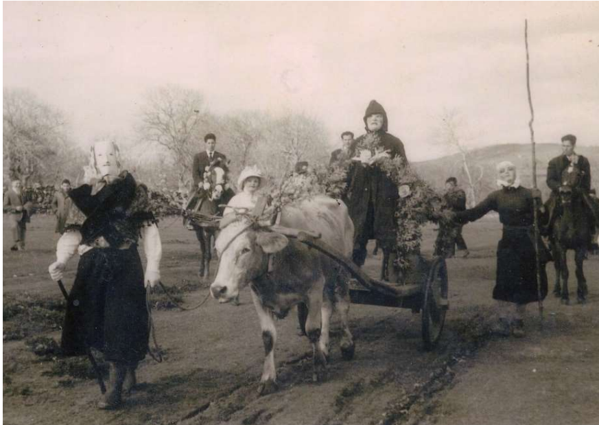
O ANTROIDO ANTIGO EN ANSEMAR que se foi configurando o modelo de Entroido da sociedade

occidental. Isto non é obstáculo para que no Entroido actual poidan influir rituais de festas de orixe antigo.