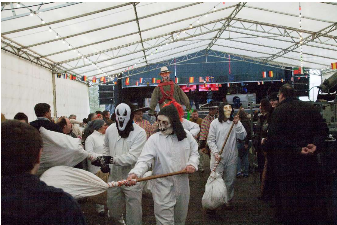
OS FARELEIROS FACENDO PASO A COMITIVA DO ANTROIDO. ANO 2014.

De todos os xeitos, malia estes obstáculos, vaise vendo como hai comunidades, que paseniño e con esforzó, van recuperando un tempo festivo, que aínda – que non igual-vai ser un reflecte. Para iso contan con axudas e subvencións económicas de institucións municipais; das Deputacións; e mesmo da Xunta para ir poñendo a punto os elementos básicos dunha tradición, que aínda conta con depositarios da mesma. Isto conleva un perigo, que como ben sinala o antropólogo Marcial Gondar , pode levar a unha manipulación e a un control institucional 29 . Con todo, hoxe, queiramolo ou non, se queremos que a festa continúe temos que botar man das axudas institucionais. E isto debido a que os tempos foron cambiando e as comunidades esmorecendo.