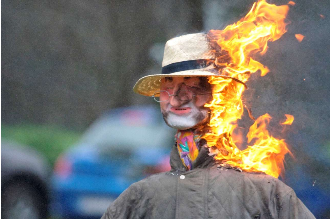
INICIO DA QUEIMA DO ANTROIDO. ANO 2014.