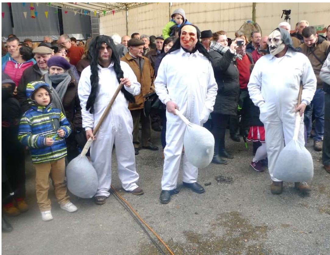
O GRUPO DOS FARELEIROS, MÁSCARA TÍPICA DO “VAL DE FRANCOS”